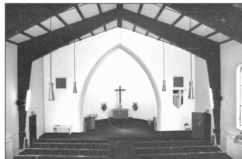
Kapelle Apsisbereich innen, August 1996