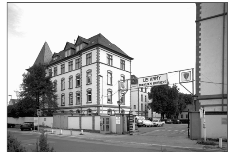
Kaserne Taukkunen Barracks, Eingang Bensheimer Straße, August 1996