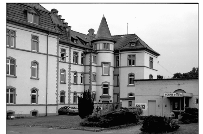
Kaserne Taukkunen Barracks Südwestecke, August 1996