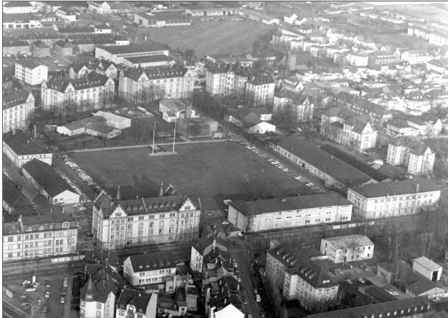
Luftaufnahme Kasernenbereich Taukkunen Barracks