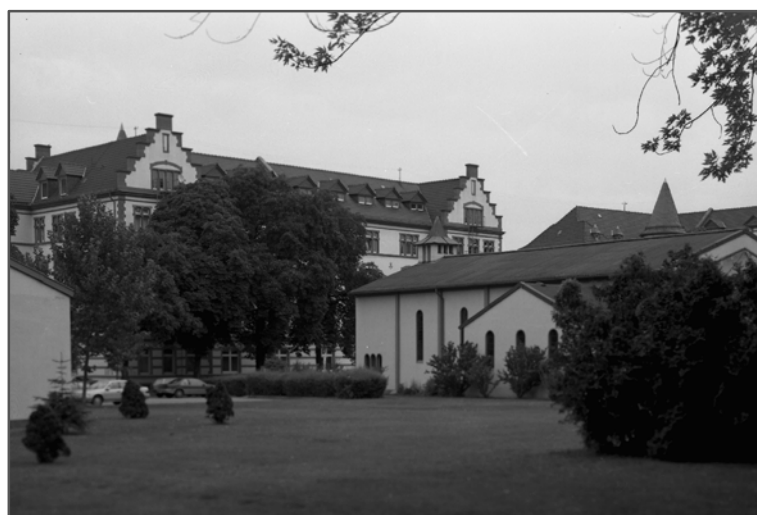
Kaserne Taukkunen Barracks mit Kapelle, August 1996