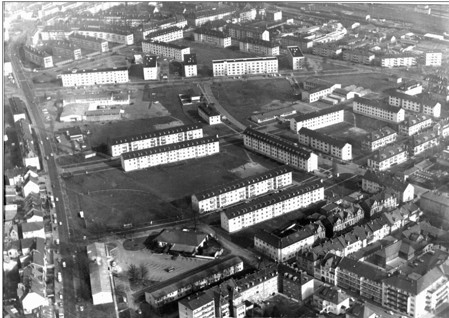
Luftaufnahme Wohnsiedlung Thomas-Jefferson-Village