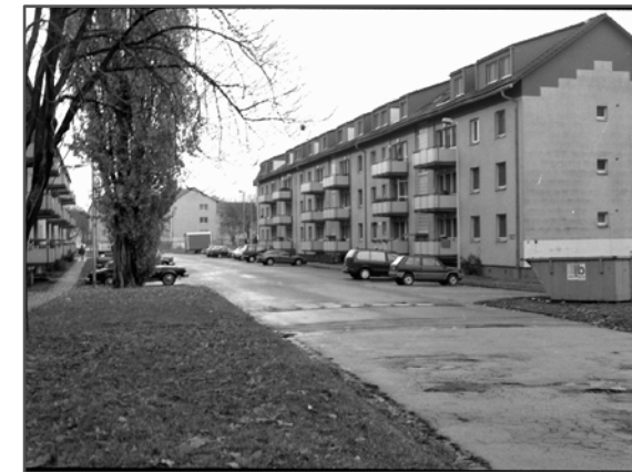
Kantstraße, November 1997