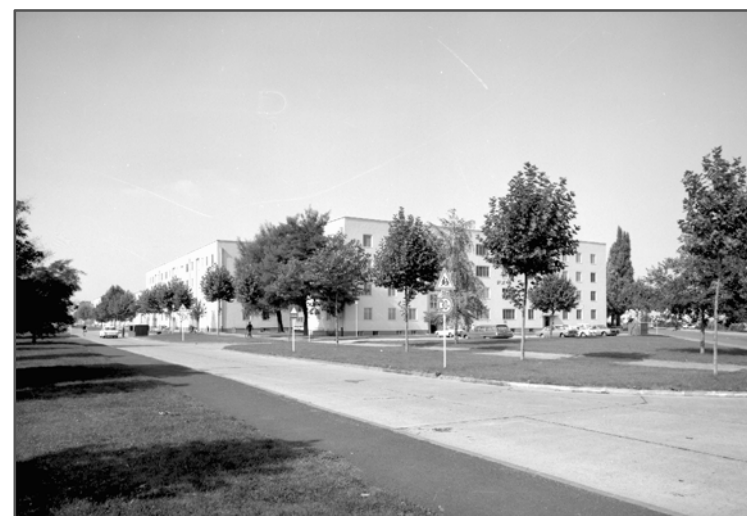
Von-Steuben-Straße, Ecke Seidenbenderstraße, September 1969