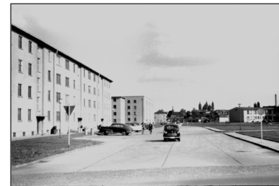
Von-Steuben-Straße, Blick zum Dom, Mai 1957