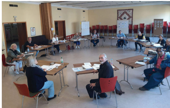
2. Klausurtagung September 2021

Kontaktieren Sie uns, wenn Sie ein Thema interessiert oder schlagen Sie weitere Themen vor. Tel.: 06241 853 5718 oder Email an seniorenbeirat@worms.de