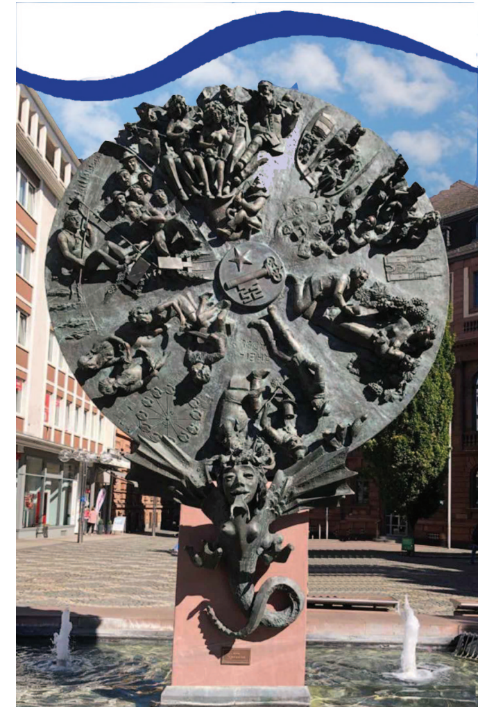
Das Foto zeigt das Wormser Schicksalsrad, geschaffen vom Wormser Künstler Gustav Nonnenmacher

Wir setzen uns für die Seniorinnen und Senioren in Worms und für eine verkehrsberuhigte und lebenswerte Stadt ein.