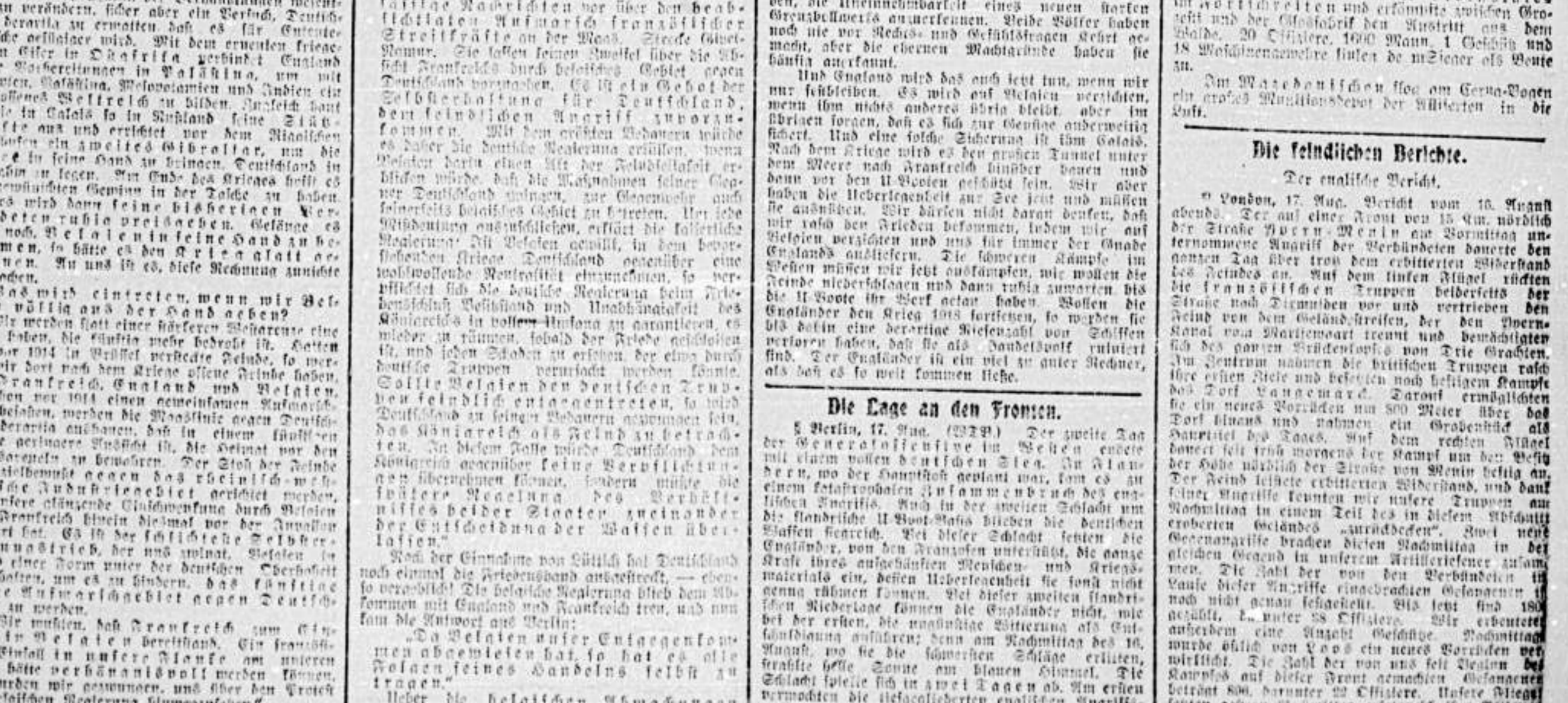
Die Bemie bei Fociani... Die Bemie bei Fociani...