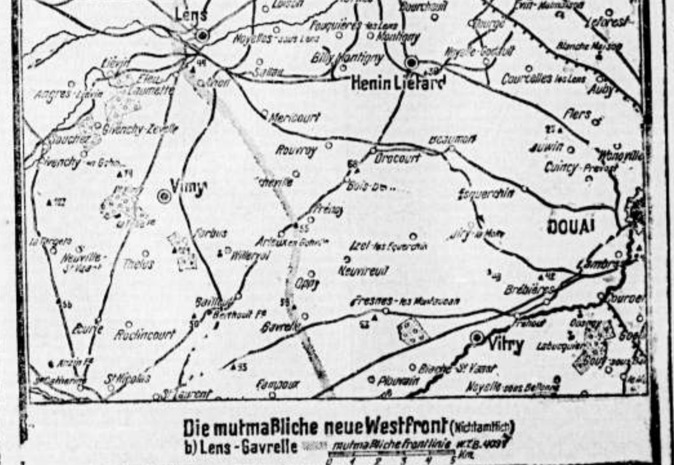
Die militärische neue Westfront (Westfront) b) Lens - Gavrelle