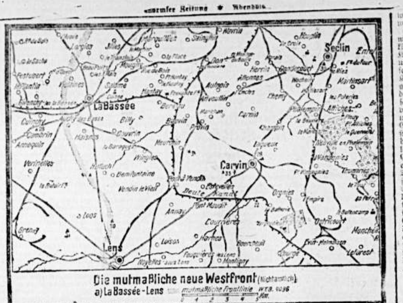
Die militärische neue Westfront (Westfront) a) La Bassée - Lens