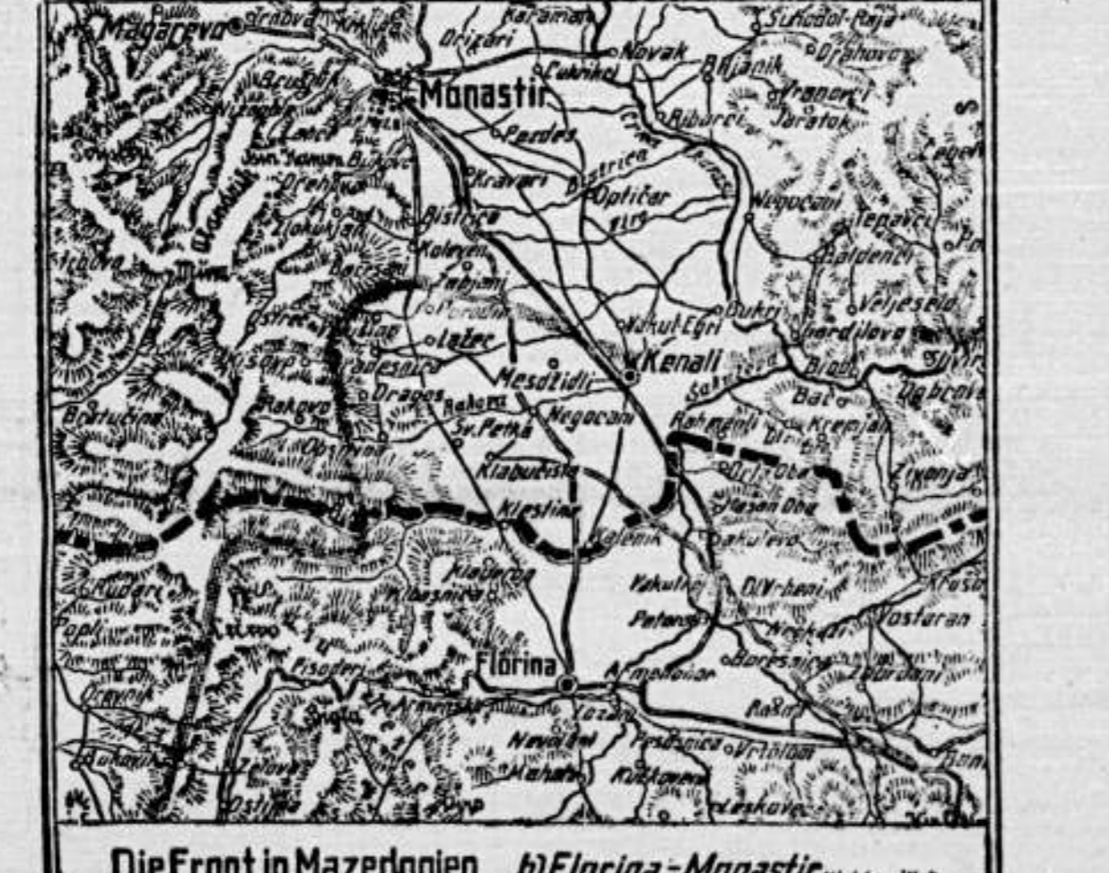
Die Front in Mazedonien ...