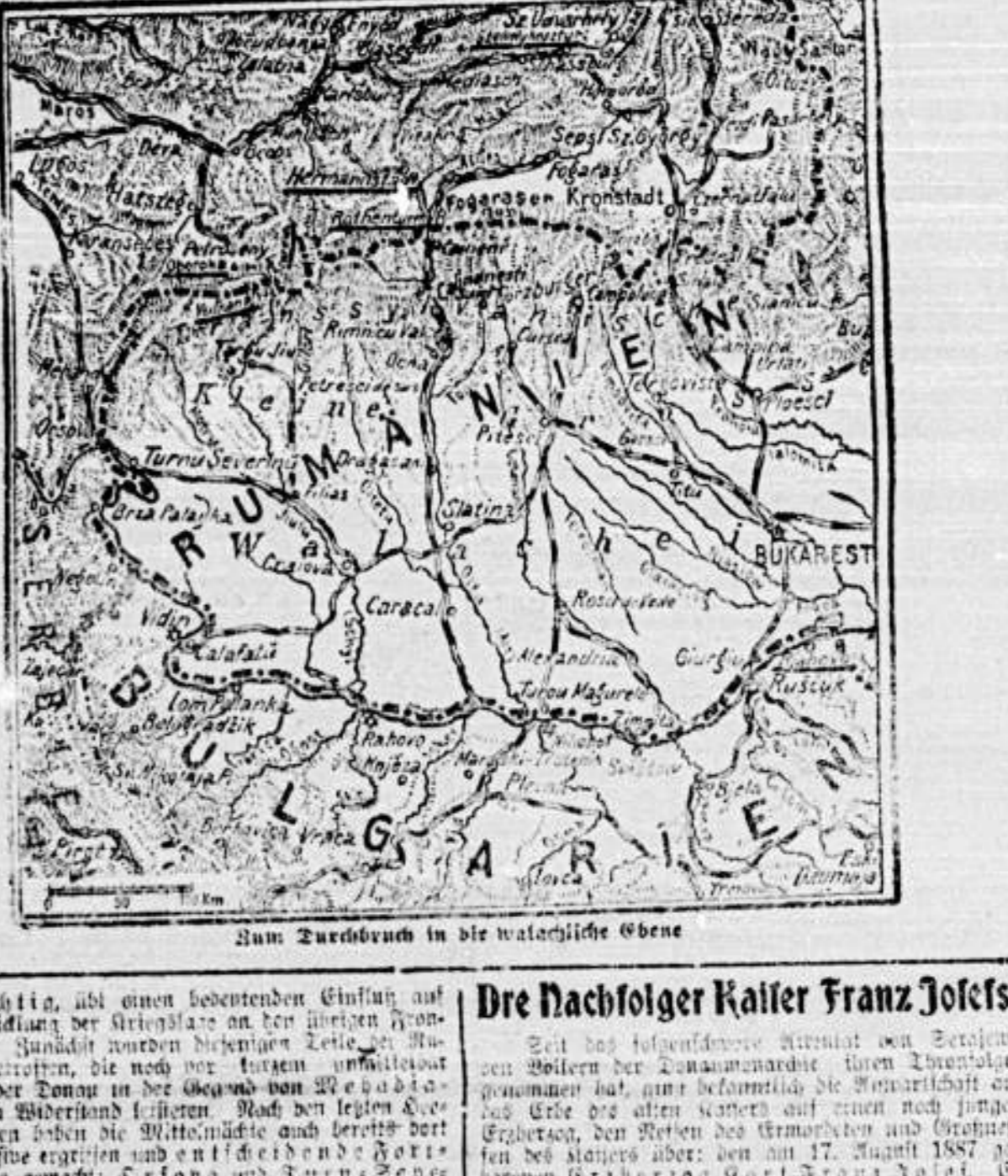
Das Rheintal in die wasserliche Ebene