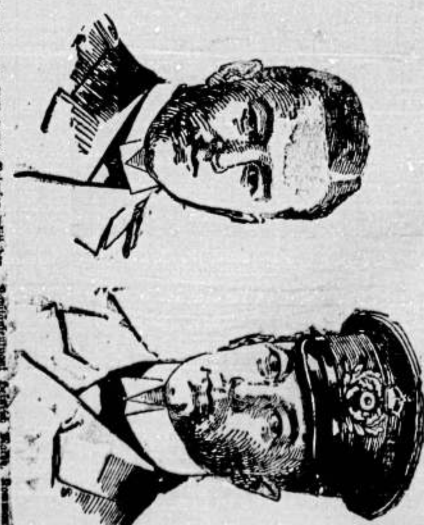
Portrait of a man in a military uniform, likely a high-ranking official.

Worms, 18. Oktober 1916. Die Morgennummer umfaßt 4 Seiten.