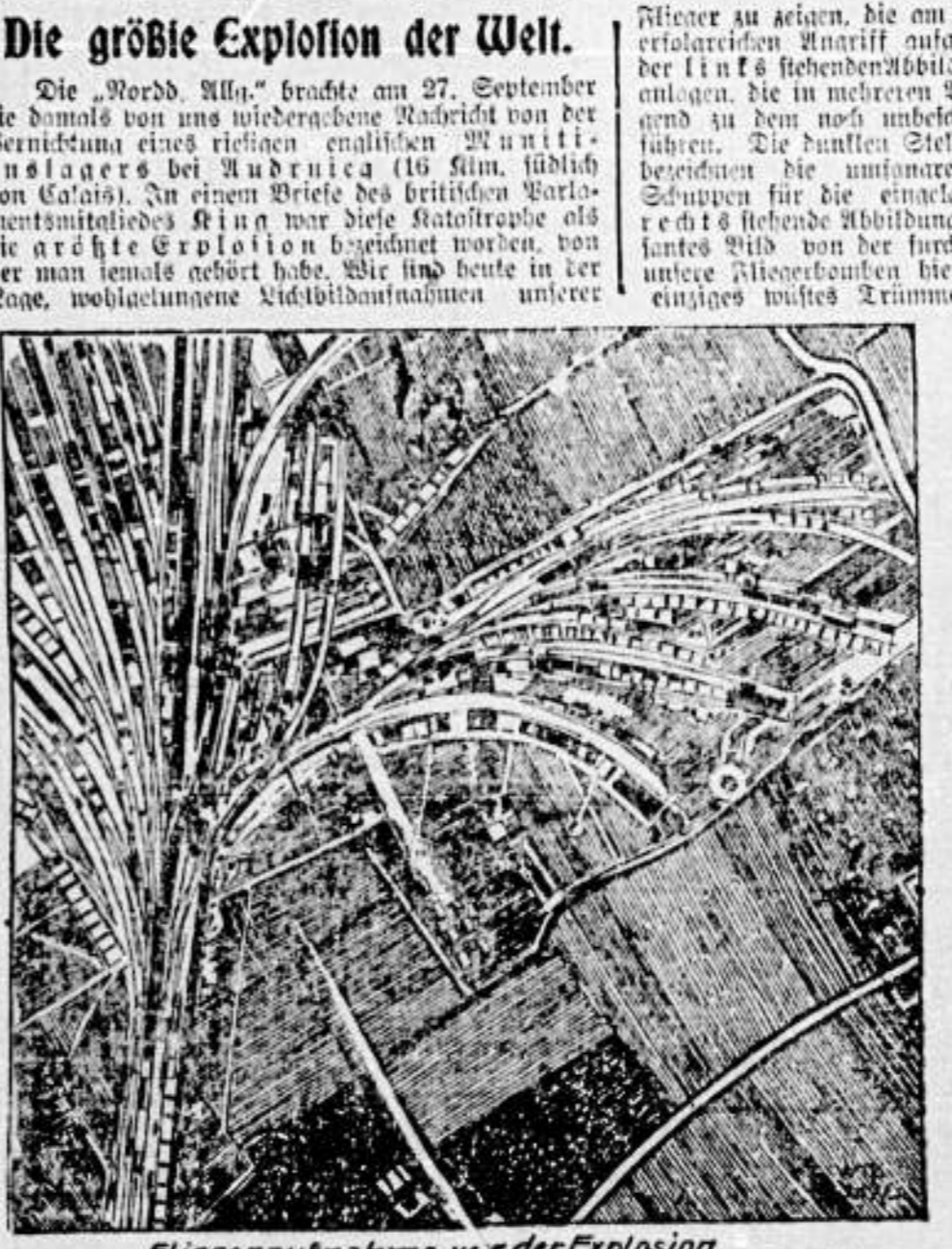
Fliegeraufnahme vor der Explosion. Das durch deutsche Flieger zur Explosion gebrachte englische Munitionslager bei Suvaiva, Galathea, Fidschi. Ein Wert von über 100 Millionen Mark zerstört.

Die größte Explosion der Welt. Die „Nord-Fla.“ brach am 27. September die damals von uns unbekannte Nachricht von der Verheerung eines riesigen englischen Munitionslagers in Galathea bei Suvaiva (Suvaiva, Provinz Galathea) in der britischen Kolonie Fidschi. In dem Bericht des britischen Parlamentarier Lord Curzon über die Verheerung des Munitionslagers in Galathea wird berichtet, dass die Explosion am 27. September 1916 in der Nähe von Suvaiva stattfand. Die Explosion zerstörte ein riesiges Munitionslager, das für die britische Flotte in der Pazifikregion bestimmt war. Die Explosion verursachte erhebliche Schäden an der Umgebung und forderte die Tode von mehreren Menschen.