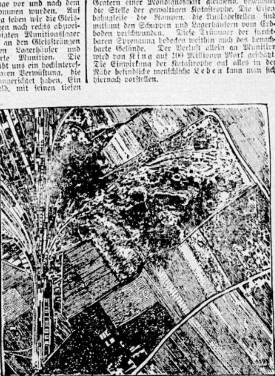
Fliegeraufnahme des Munitionslagers nach der Explosion.

Diebstahl im Kampf mit dem „Stiffman“. Der 20. Okt. (20. Okt.) Diebstahl im Kampf mit dem „Stiffman“.