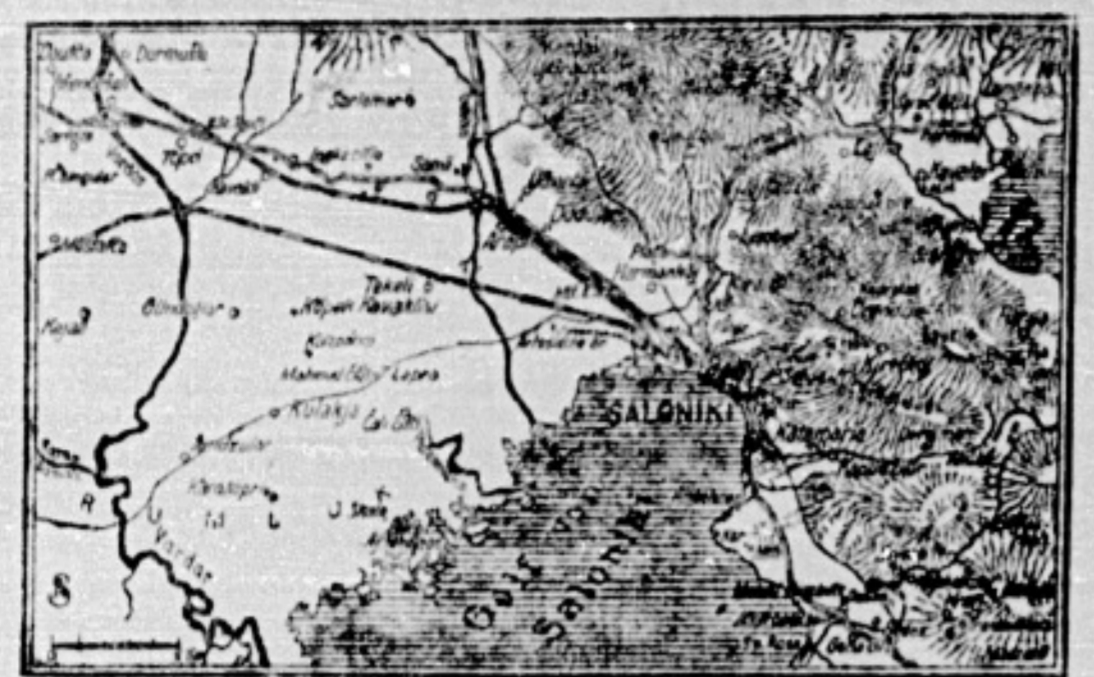
Karte von der Halbinsel von Saloniki.