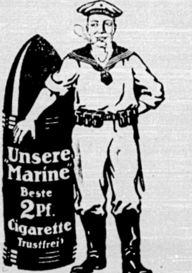
Unsere Marine Beste 2 Pf. Cigarette Truffel!