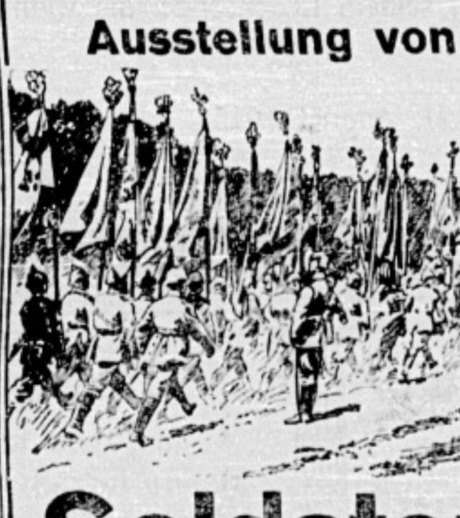
Denkmal an uns