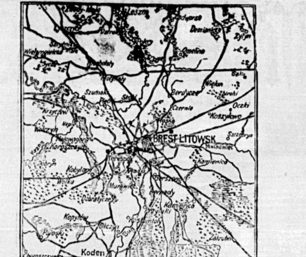
Zu unserem Vormarsch auf Brest-Litowsk.