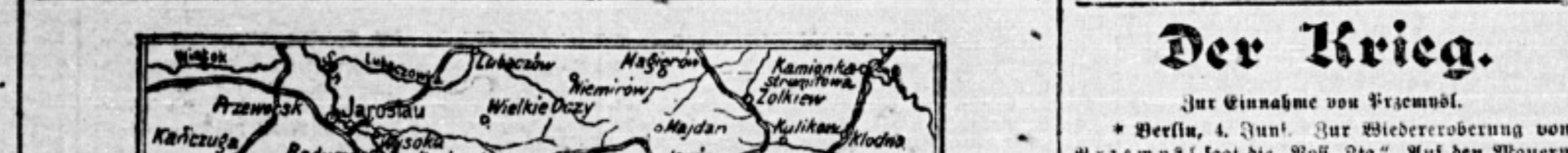
Die neuesten Meldungen über die Bewegungen der russischen Armee...