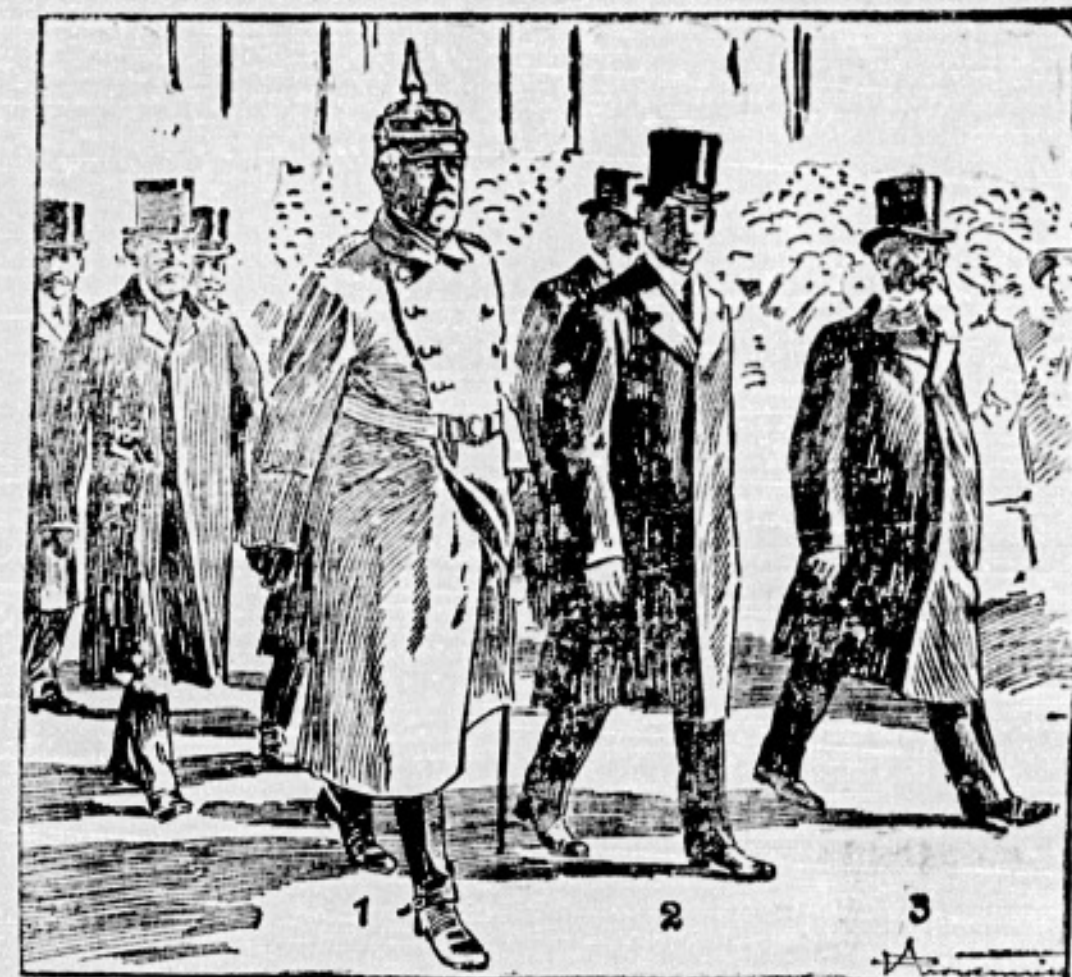
1. Heiligtum von ... 2. ... 3. ...