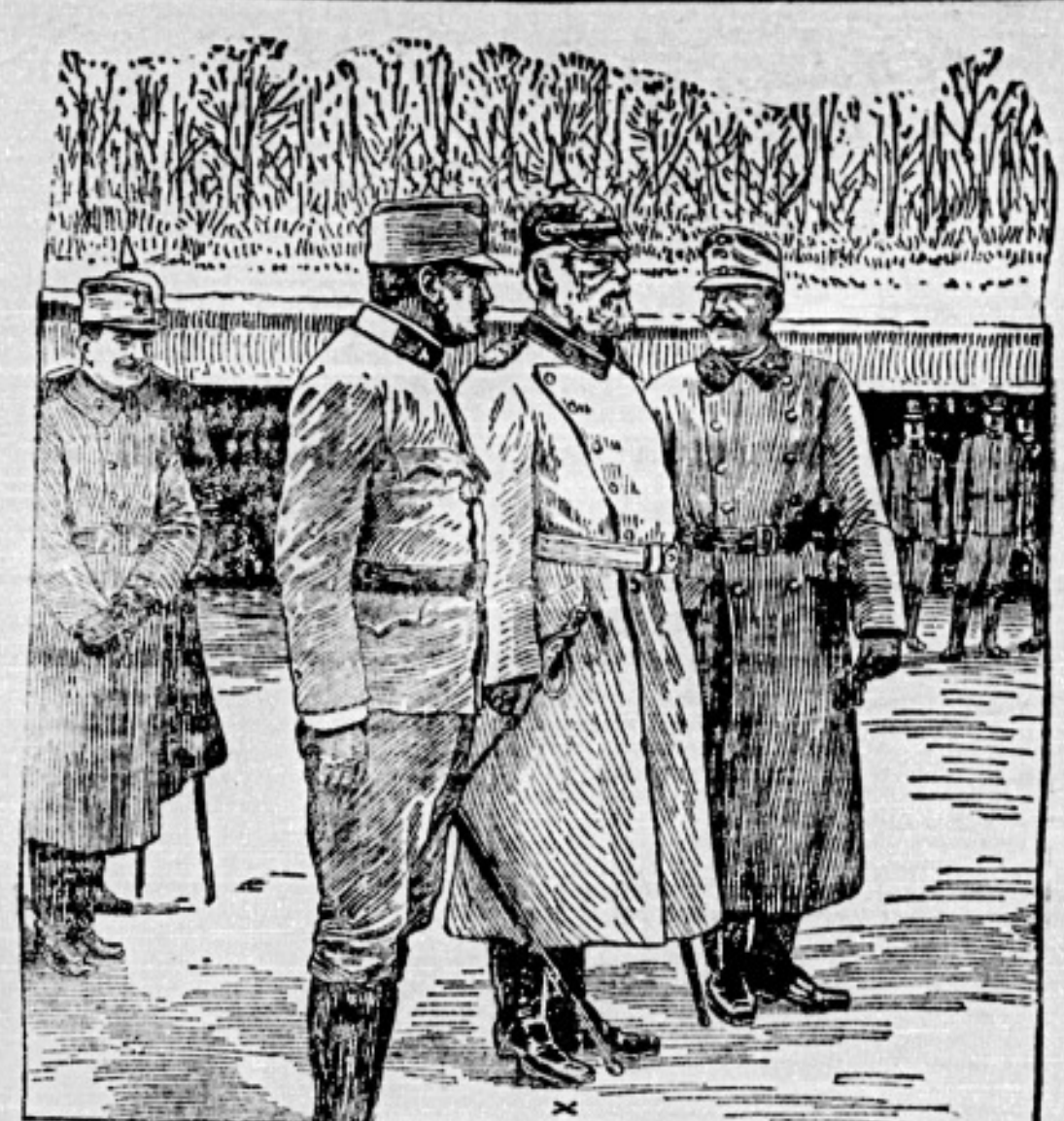
König Ludwig von Bayern ...