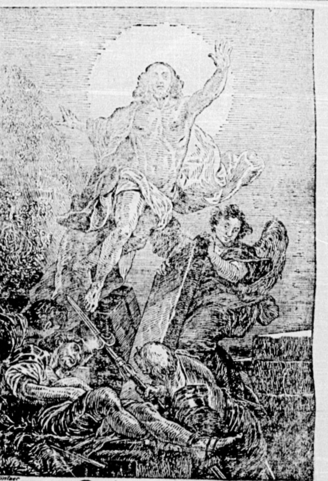
Ostern 1915. Die Kriensoster sind die Osterferien, die in jedem Augusttag im Feld leben im Leben des Wehrdienstes wieder lebendig zu werden.

Deutsche Kriensoster. Als der Reihe der Kriensoster... Die Kriensoster sind die Osterferien, die in jedem Augusttag im Feld leben im Leben des Wehrdienstes wieder lebendig zu werden. Die Kriensoster sind die Osterferien, die in jedem Augusttag im Feld leben im Leben des Wehrdienstes wieder lebendig zu werden.