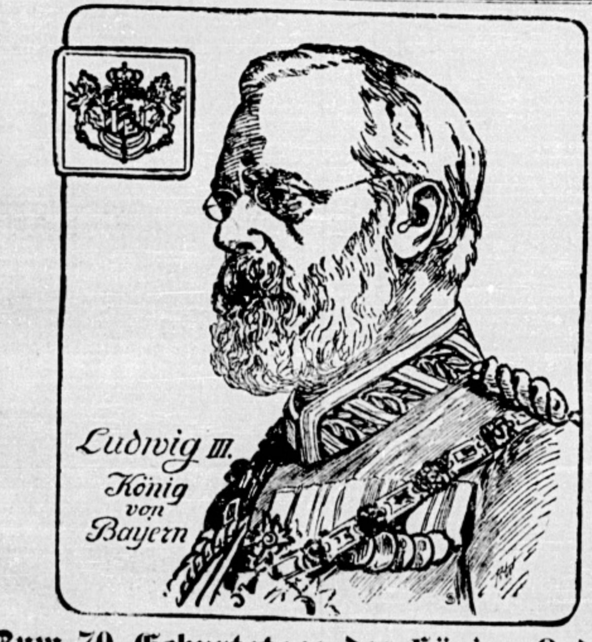
Ludwig III. König von Bayern