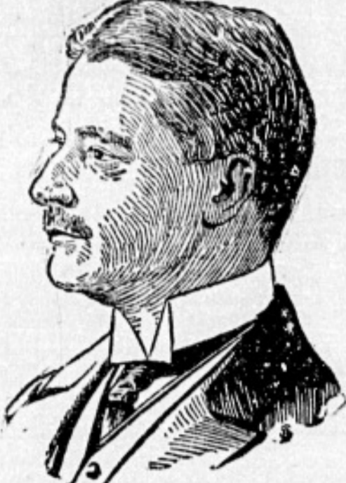
Portrait of a man, likely the author or a key figure mentioned in the text.